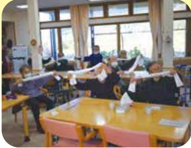
タオルで体をストレッチしました。

10月は認知症予防体操月間で10月11日(金)～15日(火)にタオル体操等でリフレッシュしました!! YouTubeのみやざき健介護予防チャンネル「座ってできるタオル体操」に合わせて利用者様がストレッチをしました! また、タオルを使ったゲームでは、タオルを2人で持って、その上にあるボールを隣の人に渡しました!!