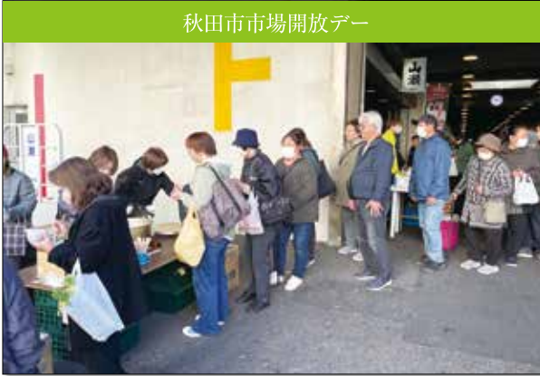
秋田市市場開放デー

秋空特産品マルシェ4商工会合同イベント、秋田市市場開放デーが開催され、湖東のやさしい畑の地場産野菜、リンゴ、揚げサンドのほか、湖東の漬物等を販売しました。また、合同イベントでは、ギノー麦みそを使用したお味噌汁、秋田市市場では、きりたんぽをお客様に振り舞い、来場者に大人気でした。旬な食材をお得にお買い求めいただけるのとあわせて、大勢のお客様で賑わい、あきた湖東の味覚をPRすることが出来ました。