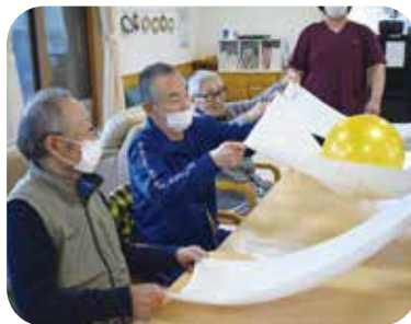
ミニゲームを楽しみました!