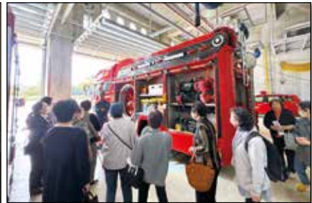
▲消防署内を見学する女性部員。

消防本部にて女性部五城目地区消費生活研修会を開催し、部員の皆様が、初期消防の模擬練習で消火器を使つての訓練を行いました。また、消防署内を見学し、消防服の着用、消防車、救急車の設備見学も行い、災害が発生した場合に素早く行動できるような心掛けました。