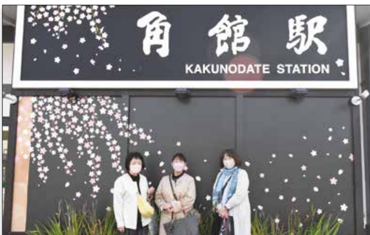
▶思い出に残る日になりました。

研修を開催し、秋田の魅力を再発見しました。紅葉や武家屋敷通りを散策し、参加者は昔ながらの武家屋敷と紅葉に見惚れ、ゆったりとした日を過ごすことができ、大満足しました。当JAはこれからも皆様にお楽しみいただける様々なイベント行事を行ってまいります。