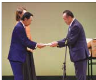
▲猿田組合長から特産品が送られました。