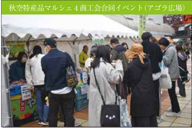
秋空特産品マルシェ4商工会合同イベント(アグラ広場)