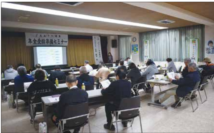
▲小杉氏からの説明を聞く参加者。