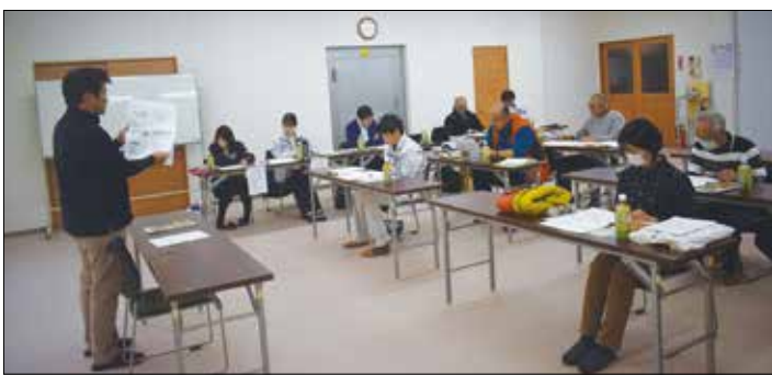
▲来年度の栽培に向け、重点事項を確認する生産者。

令和6年度トルコギキョウ実績検討会及び令和7年度トルコギキョウ品種選定会を開催し、令和6年度トルコギキョウの生育状況、県外市場情勢等について話し合いました。地域振興局の担当者からは、短茎開花の原因と対策、土壌病害対策や施肥内容の見直し等について報告がありました。また、次年度に向けての栽培管理について、品種選定会を行い、作付前の土壌分析を必ず行い、適切な施肥設計を行う事が説明されました。来年度の栽培に向けて生産者からは「丈の短さ等、生育にバラツキが出ないよう、水管理や温度管理のタイミングを見計らった栽培管理を行いたい」と話し、今後、病害虫防除や連作障害対策等の励行で高品質な生産に努める事を徹底しました。