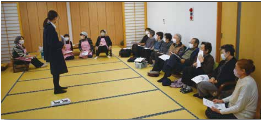
▲仲間と一緒にゲームを楽しむ皆様。

令和6年度第2回「いきいき健康講座」(ミニデイサービス)を開催し、助け合いグループ「太陽」、妹川浜老人クラブの皆様がレクリエーションとして、脳トレ体操・クイズ、じゃがいもゲームのほか、「秋田県民歌」や「ふるさと」を合唱しました。脳トレ体操では、なぞなぞ等の頭の柔軟体操を行ったほか、脳トレビンゴでは苗字や野菜を使用してゲームを行いました。