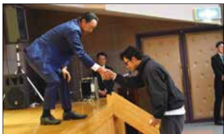
▲サイン入りボールを受け取る来場者。

八郎潟町農村環境改善センターにて、J A あきた湖東・J A 秋田やまもと合同特別記念講演「篠塚和典氏の野球人生」を開催し、フリーアナウンサー 竹山マユミ氏による司会進行のもと、元読売ジャイアンツ 篠塚和典氏、参議院議員元読売ジャイアンツ 石井浩郎氏に野球人生について講演していただきました。篠塚氏は首位打者やベストナイン等の獲得タイトルや現役時代を振り返り、「ドラフト1位指名を受け、長嶋茂雄監督からの期待が原動力になり励みになった。共に練習するライバルやファンの方に応援してもらった。共にご活躍するライバルやファンの方にとっても大事なことが選手にとっても大事だと実感した」と語りました。また、公演終了後には篠塚氏とのじゃんけんを行い、来場者へ読売ジャイアンツのレプリカユニフォーム、篠塚氏のサイン入りボールがプレゼントされたほか、篠塚氏へ両 J A からあきたこまち、椎茸、リンゴ、湖東の漬物が送られ、会場内が盛り上がりました。