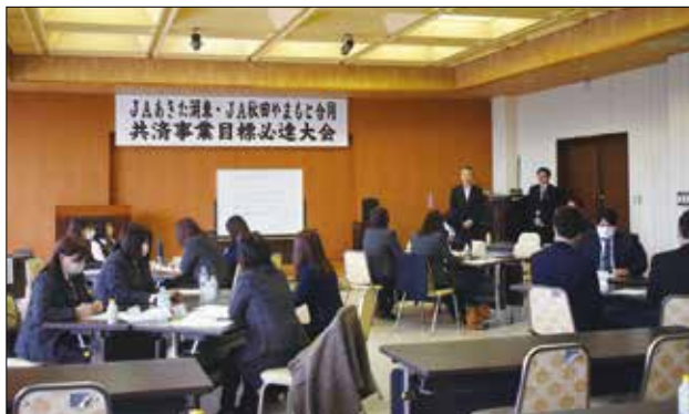
▲ライフアドバイザーが意見交換を行いました。