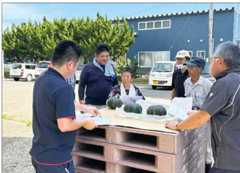
▲出荷規格表をもとにかぼちゃの品質基準を確認する生産者。

収穫を目前に控え、かぼちゃ目揃い会を行いました。収穫後の管理について、風乾作業や果実の棚もちをよくするために「日の当たらない、風通しの良い」作業小屋に並べて乾燥するほか、扇風機を夜間用いて切口の腐敗を防ぎ乾いたタオルで拭き、テリを出してから出荷することを確認しました。また、収穫した南瓜をもとに出荷規格A～B品に仕分け、高品質な南瓜の安定出荷にむけて引き続き生産者とJA関係機関が連携し、取り組むことを徹底しました。