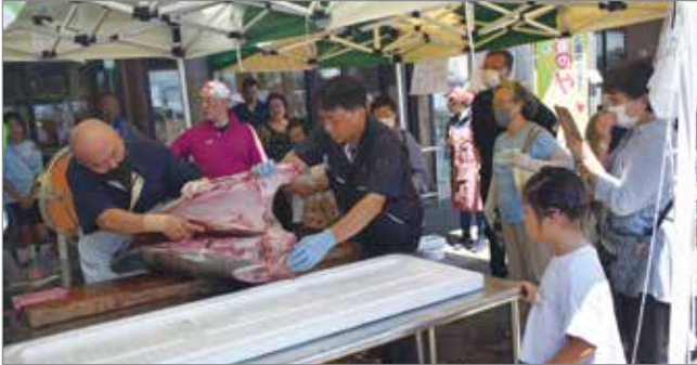
マグロの解体ショーを見物するお客様。

8月3日に湖東のやさい畑13周年祭を開催し、湖東の枝豆等の地場産野菜が立ち並び、野菜の130円コーナー、湖東の漬物の大特価、小玉すいか、秋田美人メロンの箱売りのほか、マグロの解体ショー、流しそうめんを行いました。また、8月10日から13日にかけて、お盆フェアを開催し、13周年祭とお盆フェアを合わせて6,400人のお客様にお越しいただき、大賑わいとなりました。