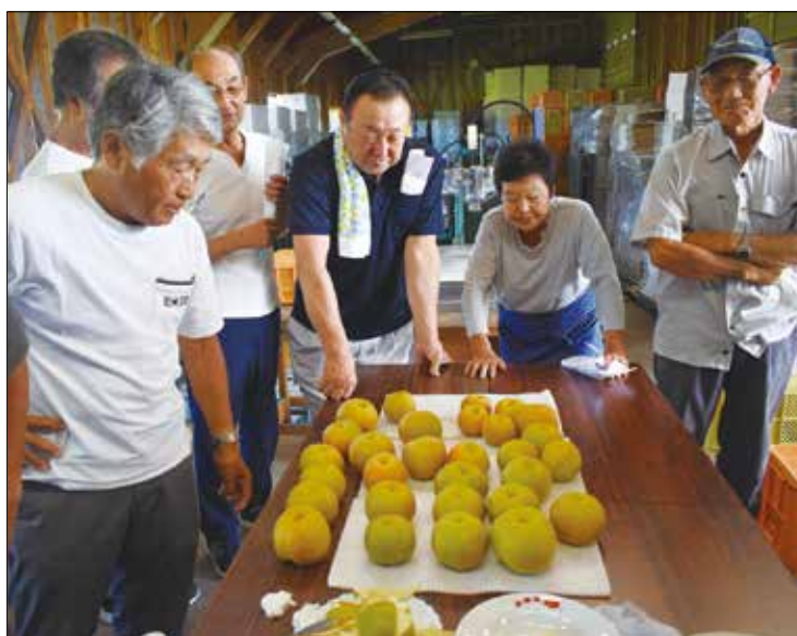
▲出荷基準をもとに良品質な湖東の梨の出荷に取り組む生産者。

昭和選果場にて、令和6年度幸水出荷説明会及び着色基準査定会を開催しました。出荷説明会では主産地の出荷等の情勢、市場情勢について確認し、引き続き日焼け果に注意し、出荷基準、品質基準をもとに出荷することを徹底しました。また、着色基準査定会では実際に収穫した幸水を手に取り、糖度や着色度合、玉揃いなどを確認し、生産者は「美味しい湖東の梨をお届け出来るように栽培管理、出荷基準を徹底します」と話しました。当JAは引き続き、湖東産の梨の安定出荷に向けて、生産者と連携を図りながら、生産に努めてまいります。