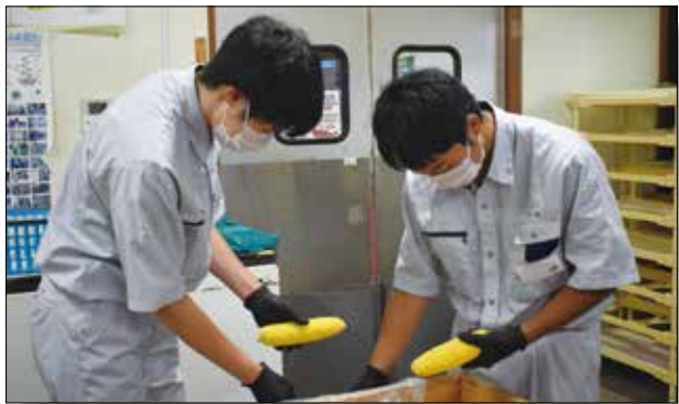
▲袋詰め、皮むき作業を行う生徒。

湖東のやさしい畑にて、金足農業高等学校2年生と井川義務教育学校8年生が職場体験学習を行いました。やさしい畑では商品の品出しや袋詰め作業等についてスタッフから教えてもらい、お客様に元気に挨拶し、綺麗に陳列することを心掛けました。生徒は「教えてもらった通り、お手伝いする事が出来ました。社会勉強のためにたくさんさんの経験をさせていただき、感謝しています」と話しました。当JAはこれからも生徒の皆様の職場体験学習のサポートを行います。