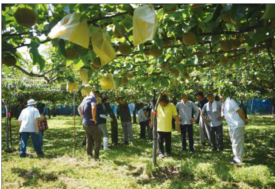
▲生育状況を確認する生産者。

湖東の梨の圃場巡回を行い、玉揃いや色合い等を確認しました。営農指導員からは収穫までの病害虫防除や栽培管理を呼びかけ、生産者は収穫に向けて管理を行い、良品質な湖東の梨をお届けすることを話しました。今後も各圃場を巡回し、安定出荷に向けて生産者の皆様と連携を図ってまいります。