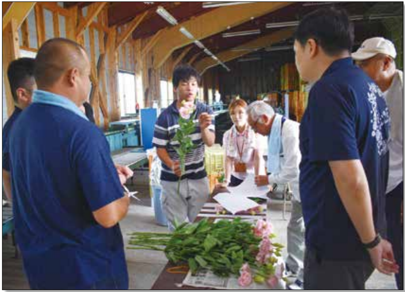
▲出荷基準をもとに秀～良品に分ける生産者。