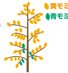
刈取り適期の 籾の熟色