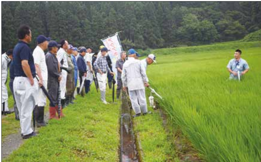
▲草丈や葉色を確認する生産者。

サキホコレ生産部会による第1回現地講習会を行いました。講習会では気象経過や生育状況について説明があり、出穂期以降の水管理が重要で米の品質と食味に影響を及ぼすほか、今年は平年よりやや早い生育で、圃場によっては減数分裂期に入っており、幼穂長から見ると出穂期は8月3～7日頃となりました。また、圃場視察では草丈や茎数、葉色を調査し、JA営農指導員が今後の肥培管理等について呼びかけました。